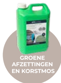
GROENE AFZETTINGEN EN KORSTMOS