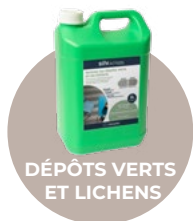
DÉPÔTS VERTS ET LICHENS