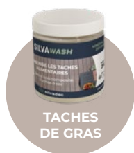
TACHES DE GRAS